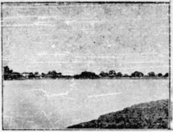
Dunărea la Tulcea