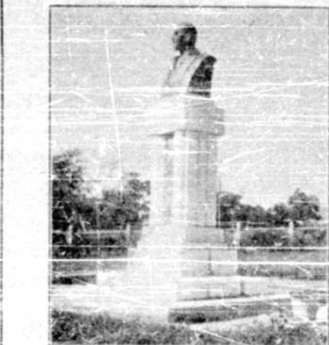
Bustul lui Ioan N. Roman

Este știut că Uniunea Camerei de comerț și industrie, a intervenit la Casa Fondului Național al Aviației, pentru a se anula procesele verbale de contravenție, dresate micilor comercianți și industriași înainte de 21 Noembrie 1938, pentru neînsușirea registrelor comerciale, C. F. N. A., a comunicat Uniunii camerei că s'a luat hotărârea a nu se mai da curs acelor procese verbale de contravenție dresate micilor comercianți pentru neînsușirea efectivă a registrelor înainte de 21 Noembrie 1938, cari s'au tot transacționat sau lichidate.